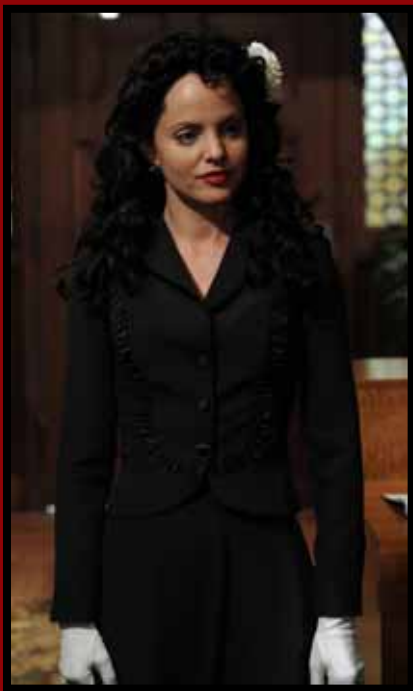
Víctima de asesinato

A las inesperadas y extrañas visitas de Constance a la mansión, se sumarán las apariciones de antiguos dueños de la casa, víctimas de horribles crímenes y una médium, que desatarán la angustia y el temor entre los distintos miembros de la familia Harmon . En distintas tramas capitulares participarán Lily Rabe (“La sonrisa de Mona Lisa”), Zachary Quinto (“Héroes”), Sarah Paulson (“Deadwood”), así como Mena Suvari (“American Beauty”) y Eric Close (“Sin rastro”), respectivamente, dando vida a esta serie de turbulentos personajes. La ficción contará también con el “cameo” de Josh Malina (“El ala Oeste de la Casa Blanca”).