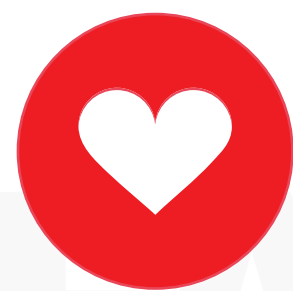
IMAGEN BANCO SANTANDER 8 Nota media