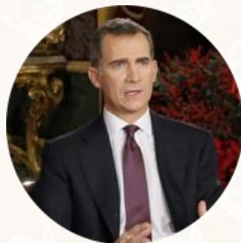
Mensaje del rey